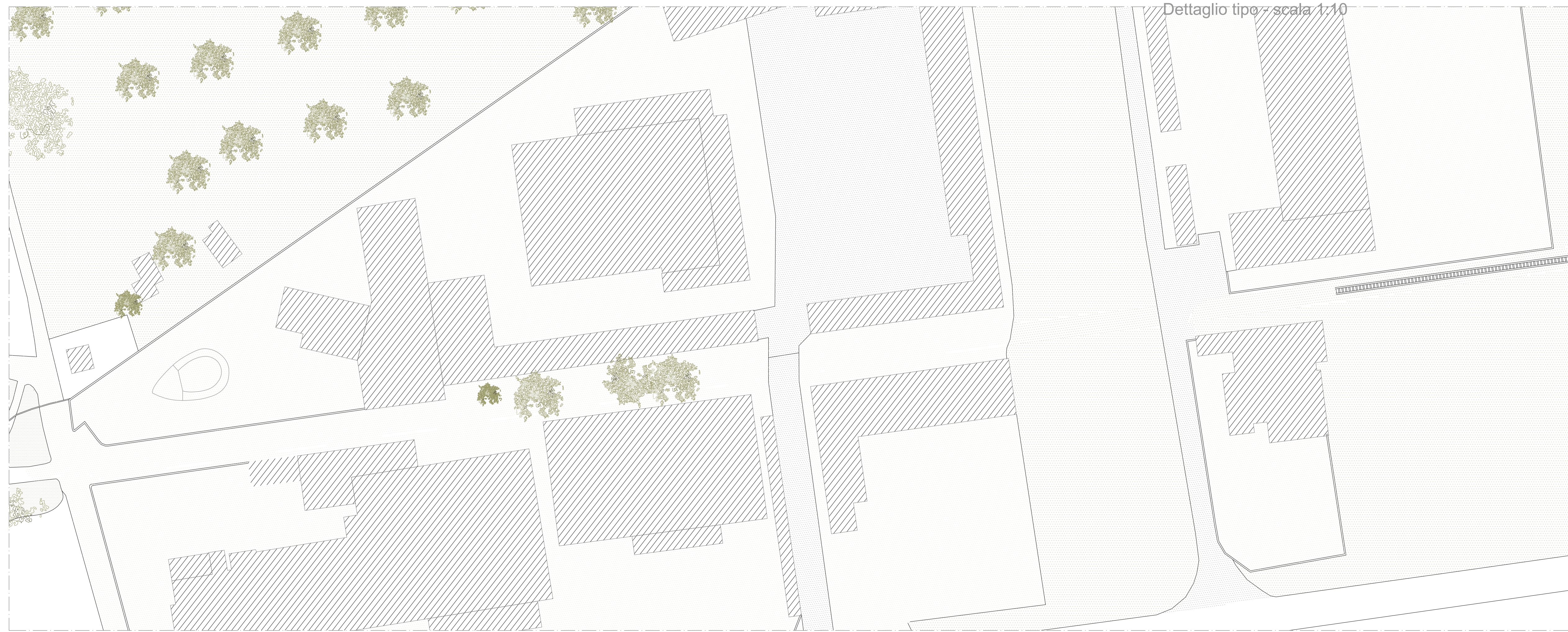
Dettaglio tipo - scala 1:10